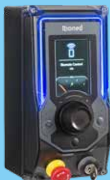
eControl+ kontrollpanel (med RioMote radio kontroll)