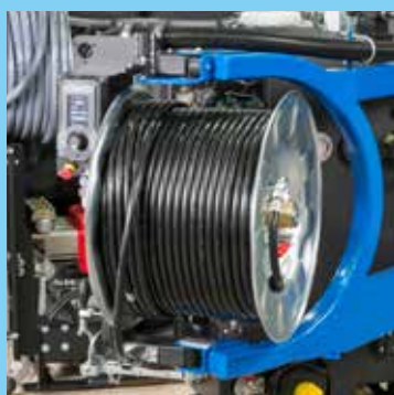
Svängbar och roterande slangrulle