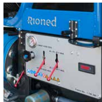
Varmvatten som tillval 85°C